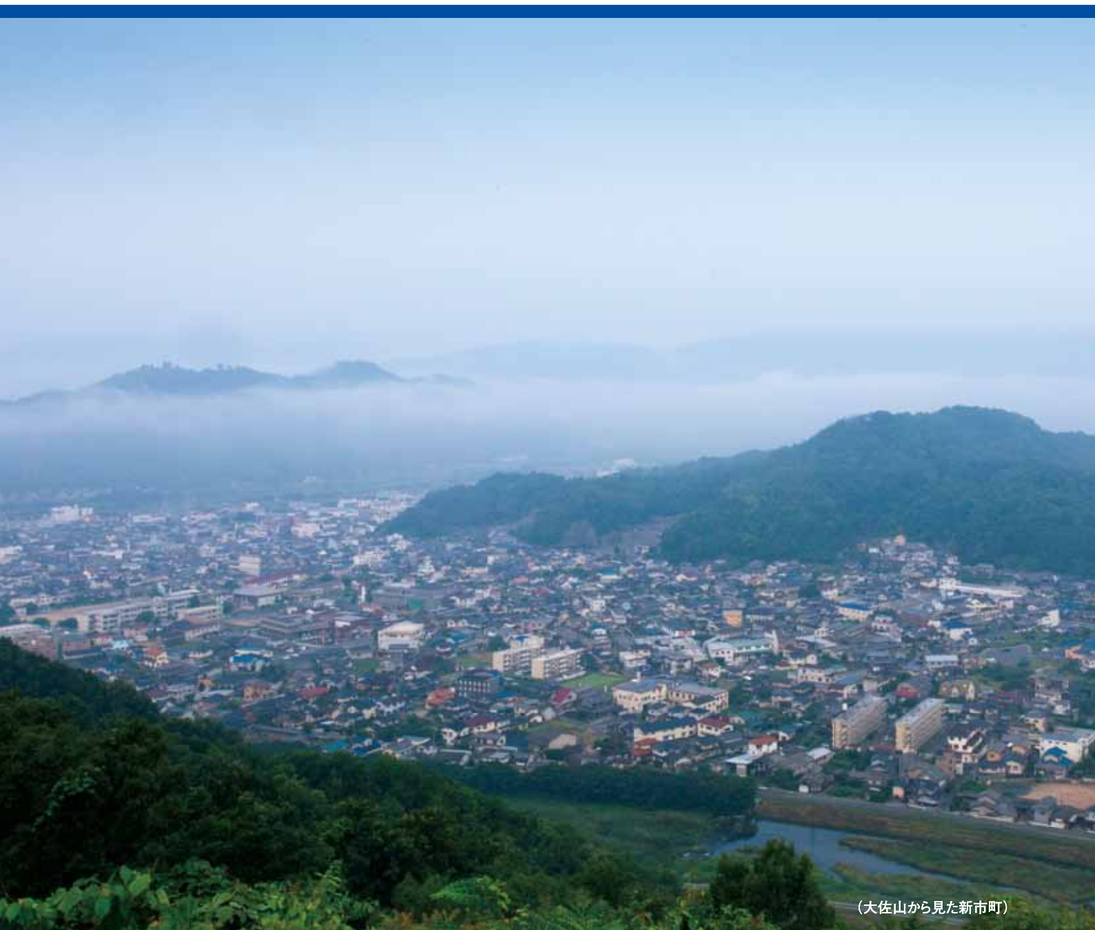
(大佐山から見た新市町)